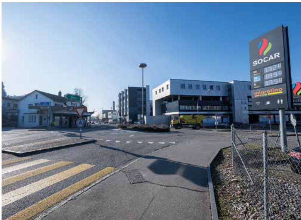
Das Kreiselszentrum wird nach Osten verschoben und der Kreiseldurchmesser vergrößert.