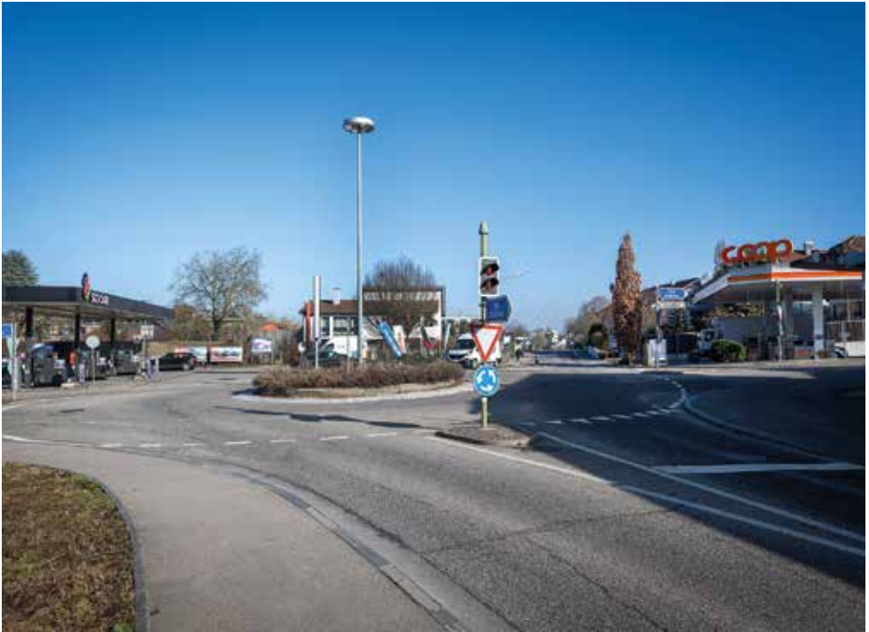
Der Kreuzwegkreisel entspricht nicht mehr den heutigen Anforderungen.